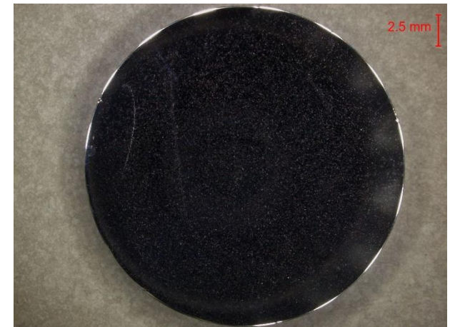
図：アルミのマイクロ스코プ画像

※『X線マイクロアナライザによる分析(マッピング)』の成績書にマイクロ스코プ画像は付属しません。