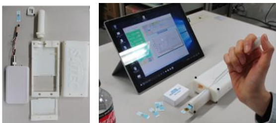
図1 試作装置の概観

図1および表1に、試作装置の概観と概略仕様を示した。電極にはインターケミ(株)製スクリーン印刷白金電極DRP220BTを用いた。同電極用コネクタを(有)バイオデバイステクノロジー製無線小型ポテンショスタットBDT100Rに接続し、電極固定および防振の機能を備えた3Dプリント製ボックスに収納した。条件設定や本体の制御はタブレット端末からの無線制御により行った。