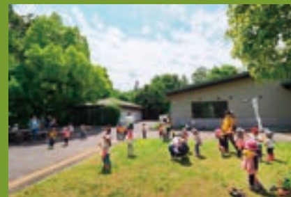
埼玉県自然学習センター・ 北本自然観察公園 (電話048-593-2891)

入館無料で、土日祝日を中心に、自然観察会や自然工作教室など様々な自然関連イベントを行っています。