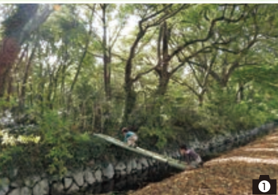
◀第19回コンクール 優秀賞「山崎山大冒険」