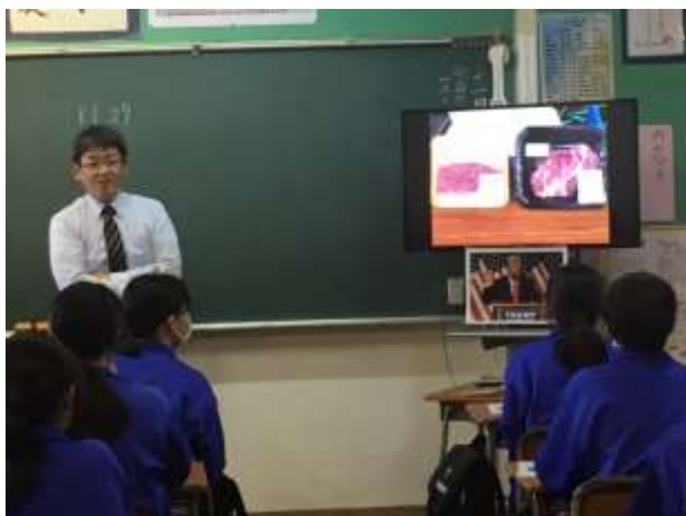
【疑問を生み出す意図的な問いかけ】