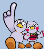
コバトン&さいたまっちゃん