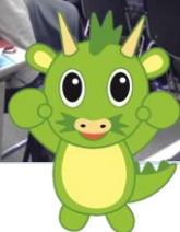
さいたま市PRキャラクター つなが竜メウ