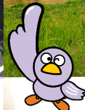
埼玉県PRキャラクター コバトン