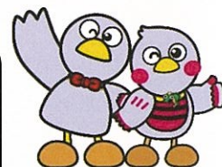
埼玉県マスコット 「コバトン」「さいたまっちゃん」

裏面の申込書に必要事項を記入の上、(公財)埼玉県国際交流協会に 郵送またはFAXでお送りください。