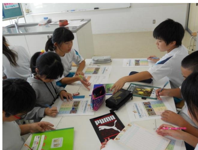
グループで課題解決