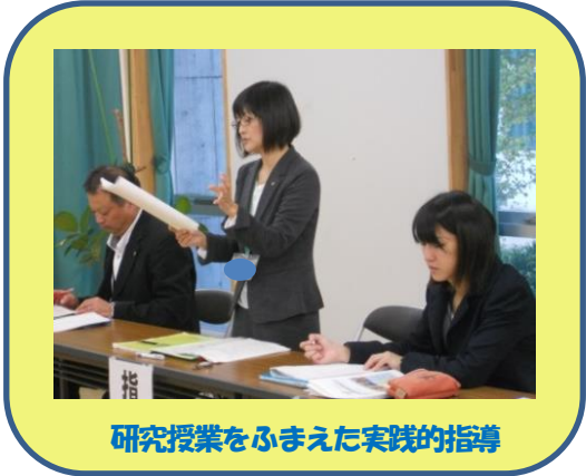
研究授業をふまえた実践的指導