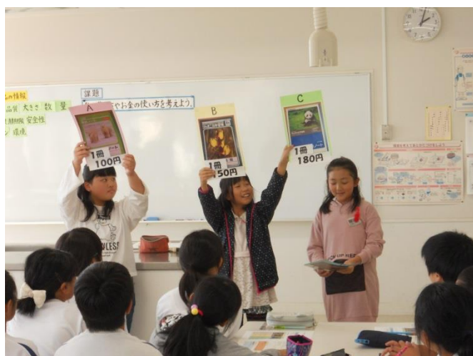
ロールフレイを活用した導入の工夫