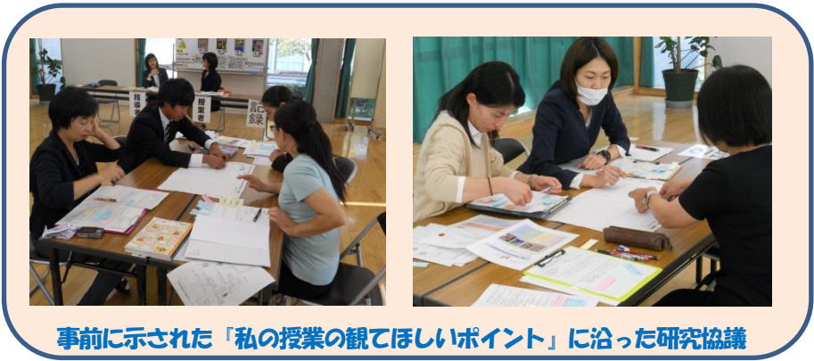
事前に示された「私の授業の観てほしいポイント」に沿った研究協議