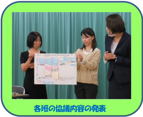
各班の協議内容の発表