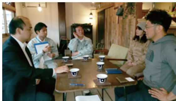
▲支援チーム・スペシャリストとの個別相談

こうした支援のもと、本年4月に法人化を実現した吉川市の株式会社つまベジを御紹介します。