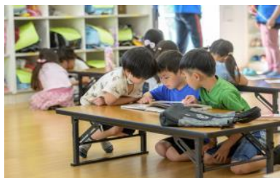
放課後児童クラブ