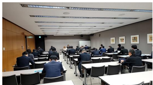
令和7年度 市場公募地方債発行団体合同IR

埼玉県も参加し、予算・決算など財政状況と今後の見通しなどについて説明しています。