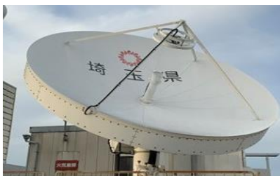
衛星系防災行政無線