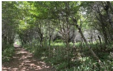
公有地化した緑地