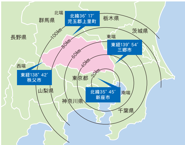
(県土地水政策課「土地利用現況把握調査」)

(総務省「国勢調査」 県土地水政策課「土地利用現況把握調査」 県統計「県民経済計算」)