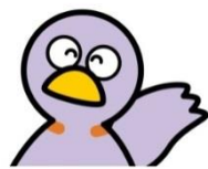
埼玉県のマスコット 「コバトン」