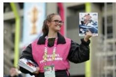
前回イングランド大会のボランティア