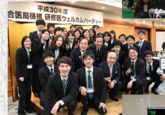
臨床研修医交流会 (H30.4.14)