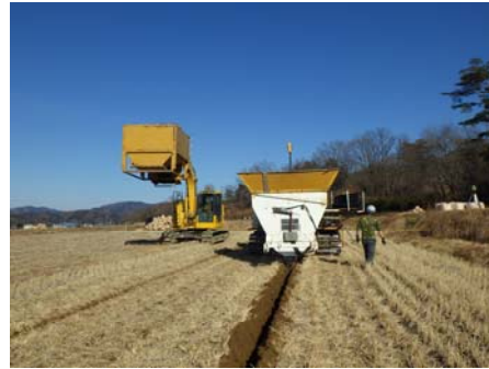
暗渠排水工実施状況