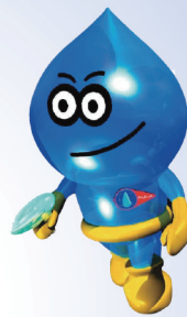
埼玉県営水道のマスコット 「ウォー太郎」