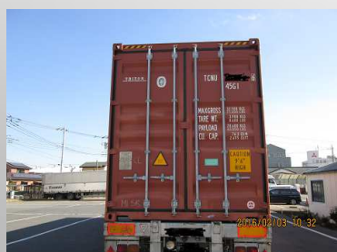
ラウンドユースコンテナ 作業チェックリスト