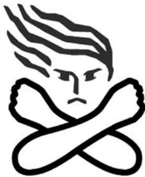
女性に対する暴力根絶のためのシンボルマーク

このシンボルマークは、男女が手を取り合っている様子をモチーフにし、互いに尊重しあい、共に歩いていけたらという願いをこめています。