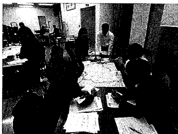
平成30年度研修の様子（グループワークの様子）