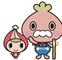
川島町:かわべえ&かわみん