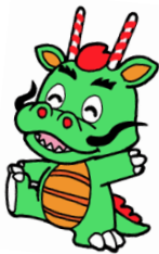
鶴ヶ島市:つるゴン