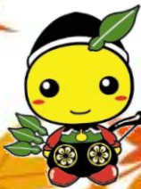
毛呂山町:もろ丸くん