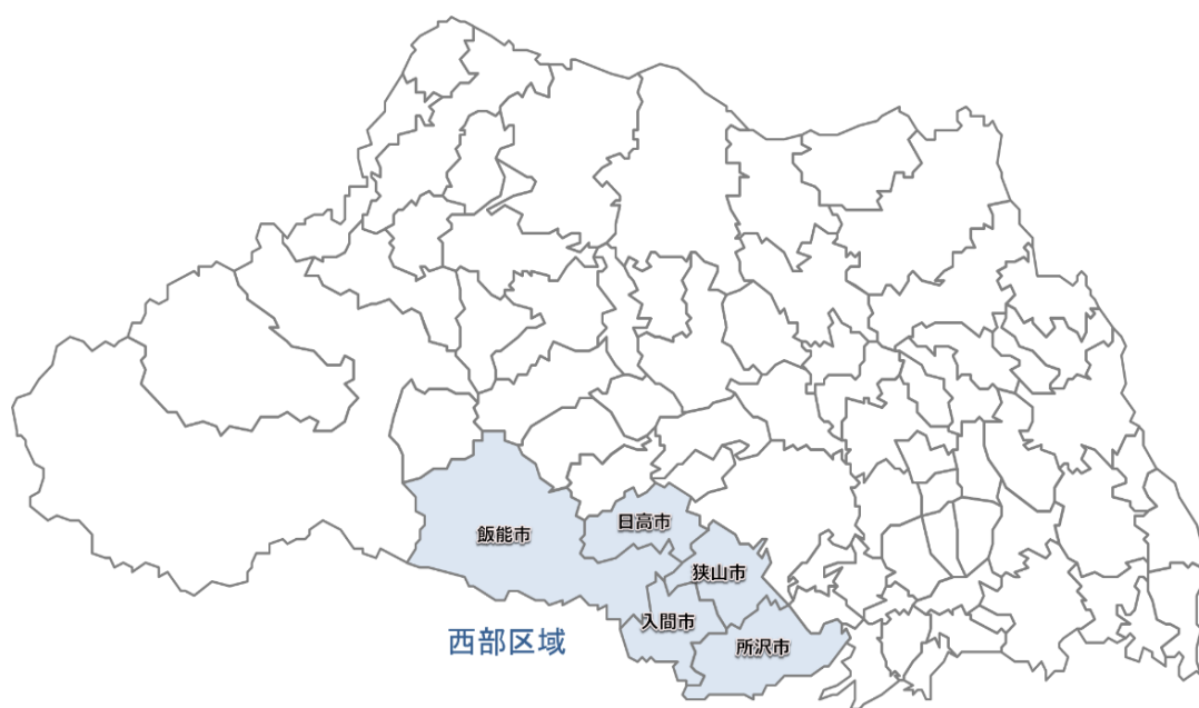
所沢市の人口将来推計