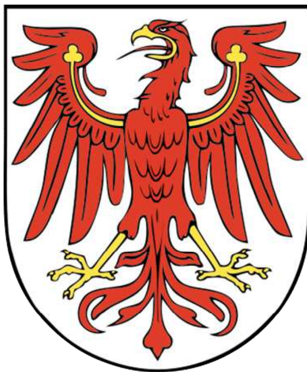
ブランデンブルグ州の州章