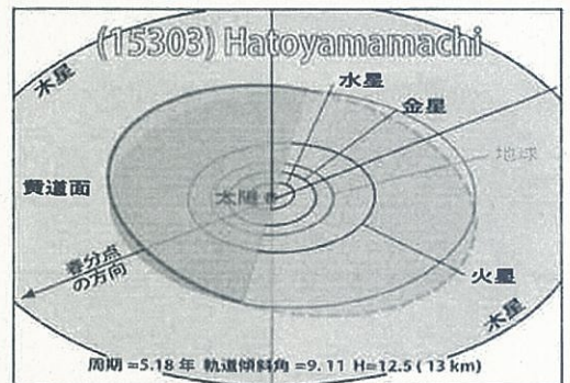
太陽系における“(15303)鳩山町”の軌道図

最近、地球に帰還し話題になった探査機「はやぶさ」が到達した小惑星“イトカワ”は、500mほどしかありませんでした。