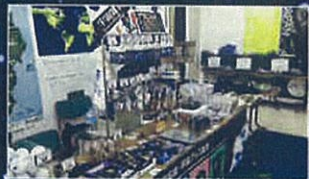
宇宙の店による展示販売も実施