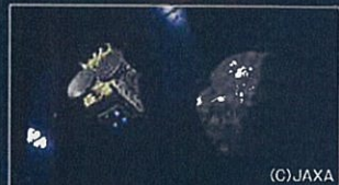
はやぶさ2号のイメージイラスト

宇宙及び地球観測のパネル展示を行います。また、「宇宙の店」では、JAXAグッズなどの販売を行います。