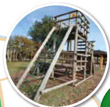
フィールドアスレチック