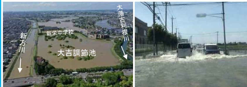
大吉調節池(新方川)周辺 令和5年6月3日午後