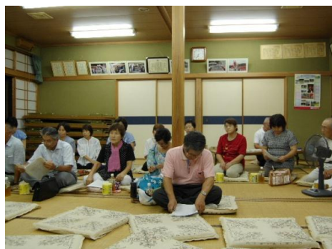
各集会所で説明会を開催

具体的には、国保連合会から入手した医療関係の資料を基に、入院外のレセプト件数及び医療費の上位2傑である「高血圧性疾患」「糖尿病」に関する予防の取り組みをお願いしているところある。