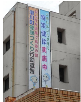
庁舎に掲げられた懸垂幕