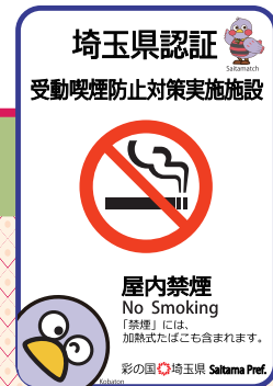
埼玉県認証ステッカー